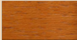
CHENGAL TL 114