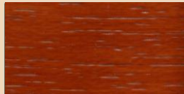
TEAK TL 104