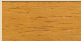
GOLD BAR TL 101