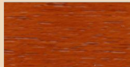
GOLDEN PUMPKIN TL 105