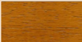
OAK TL 116