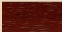
MAHOGANY TL 102