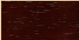
MERANTI TL 107