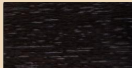
CHARCOAL TL 110