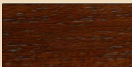
WALNUT TL 113