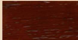
BEECH TL 106