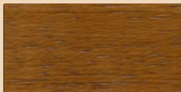
OLIVE TL 112