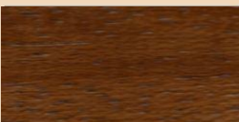
KERANJI TL 115