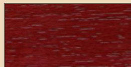
KOSSAN TL 111